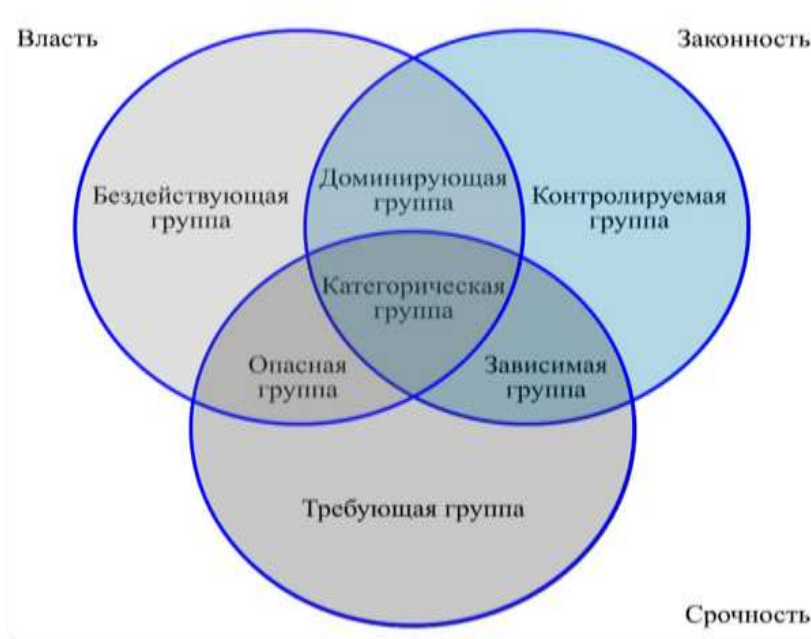
Рисунок 2. Модель Митчела, Агла и Вуда

53. В латентную категорию стейкхолдеров входят бездействующая группа (обладает фактором власти), контролируемая (обладает фактором легитимности требований) и требующая (обладает фактором срочности).