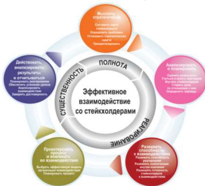
Рисунок 1. Развитие взаимодействия с заинтересованными сторонами